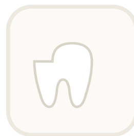
Umyj też zęby